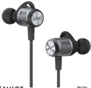
AVIOT 取説: v1.01

このたびは弊社のBluetoothイヤホンをお買い上げいただき、誠にありがとうございます。ご使用になる前に、こちらのマニュアルをお読みください。